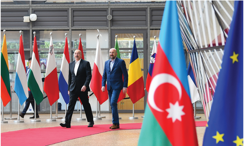
Avropa İttifaqı Şurasının prezidenti Şarl Mişel ilə görüş. 14 may 2023-cü il