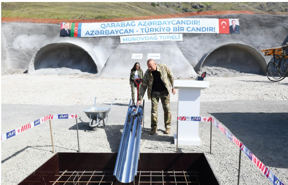
Murovdağında inşa olunacaq 11.6 kilometrlik tunelin təməlinin qoyulması mərasimi. 16 avqust 2021-ci il