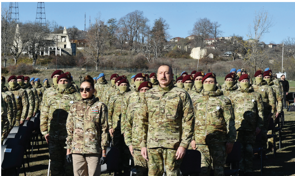
Şuşada hərbcilərlə görüş. 8 noyabr 2021-ci il