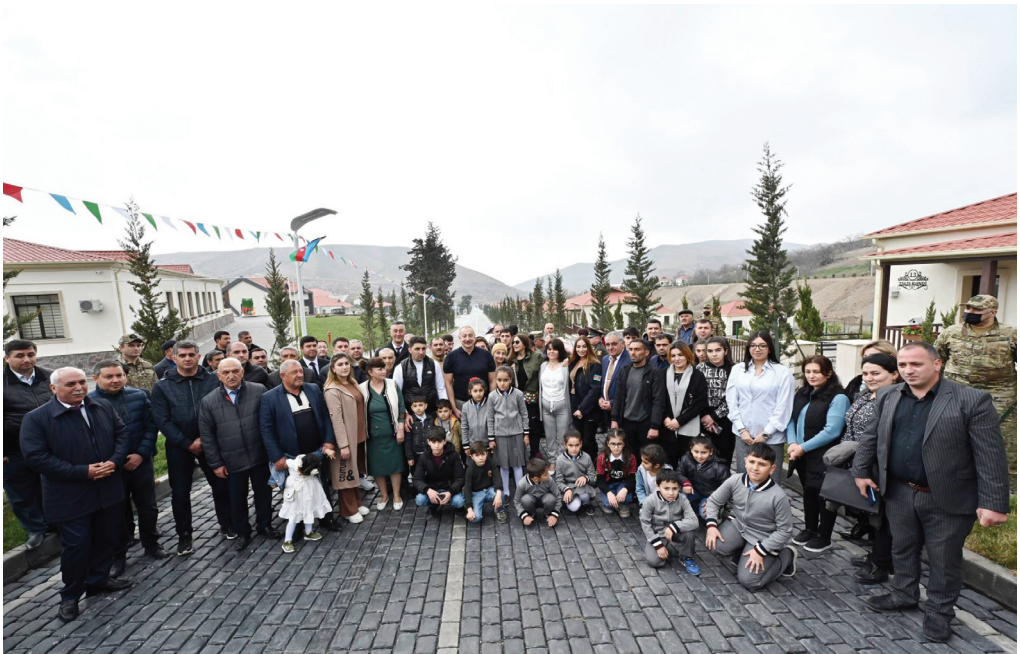
Talış kəndində. 18 mart 2023-cü il