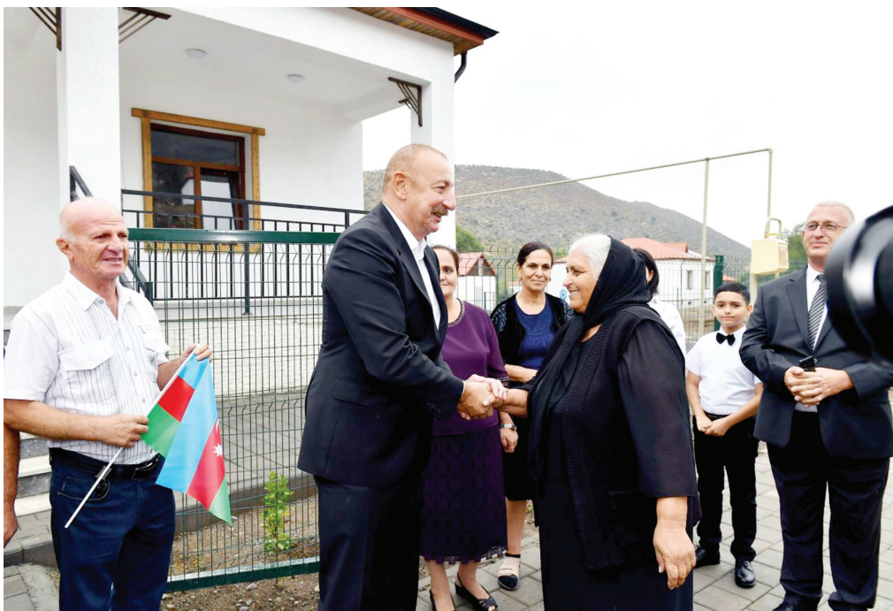
Laçının Zabux kəndində . 26 avqust 2023-cü il