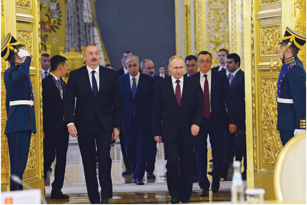
Ali Avrasiya İqtisadi Şurasının iclası. 25 may 2023-cü il