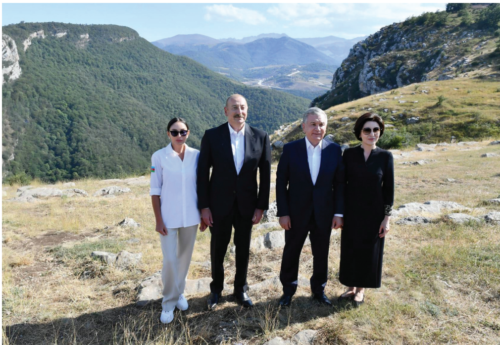
Azərbaycan və Özbəkistan prezidentlərinin Şuşaya səfəri. 23 avqust 2023-cü il