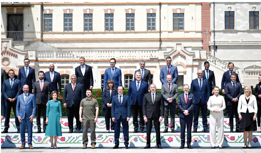
Kişineuda "Avropa siyasi birliyi"nin 2-ci Zirvə toplantısı. 1 iyun 2023-cü il