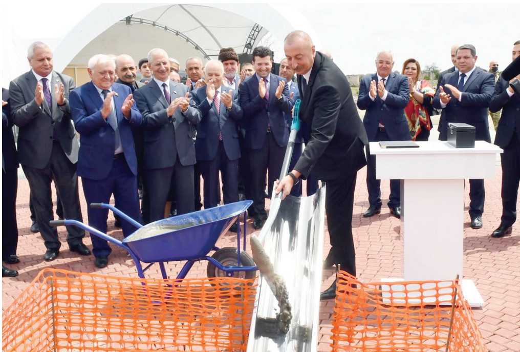
Ağdam şəhərinin bərpasının təməl daşının qoyulması mərasimi. 28 may 2021-ci il