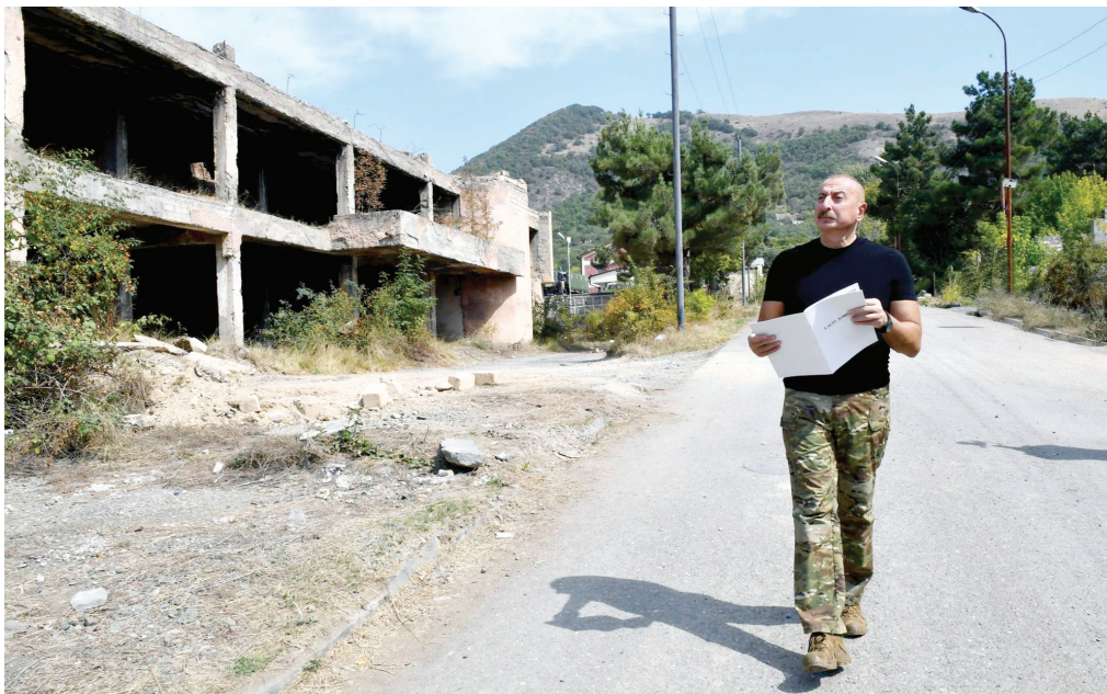
İlham Əliyev Laçın şəhərində. 21 sentyabr 2022-ci il