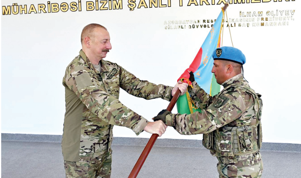
Müdafiə Nazirliyinin Komando hərbi hissəsinə döyüş bayrağı təqdim edilərkən. 23 iyun 2023-cü il

İLHAM ƏLİYEV AZƏRBAYCAN RESPUBLİKASININ PREZİDENTİ, SİLƏHLİ QÜVVƏLƏRİN ALI BAŞ KOMANDANI