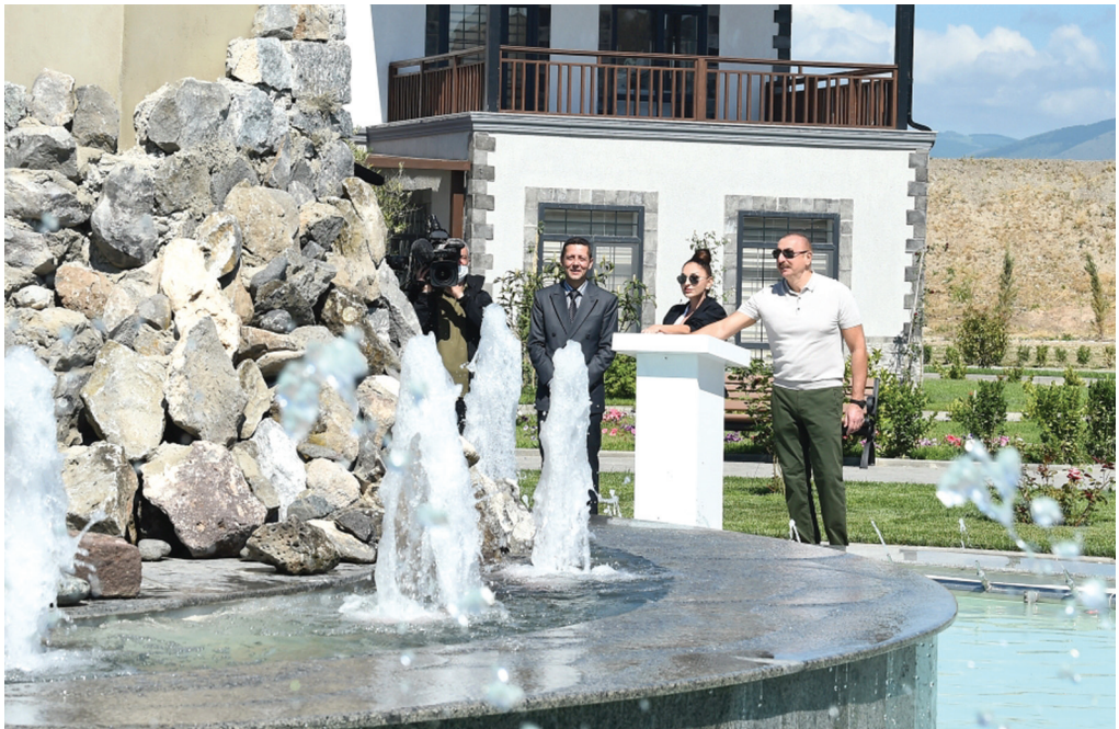
Zəngilan rayonunda "Ağıllı kənd" layihəsinin açılış mərasimi. 27 may 2022-ci il