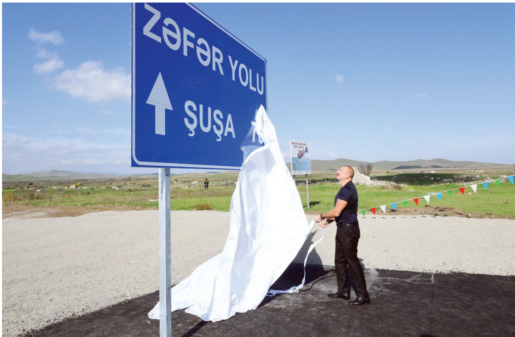
Zəfər yolunun açılışı. 7 noyabr 2021-ci il