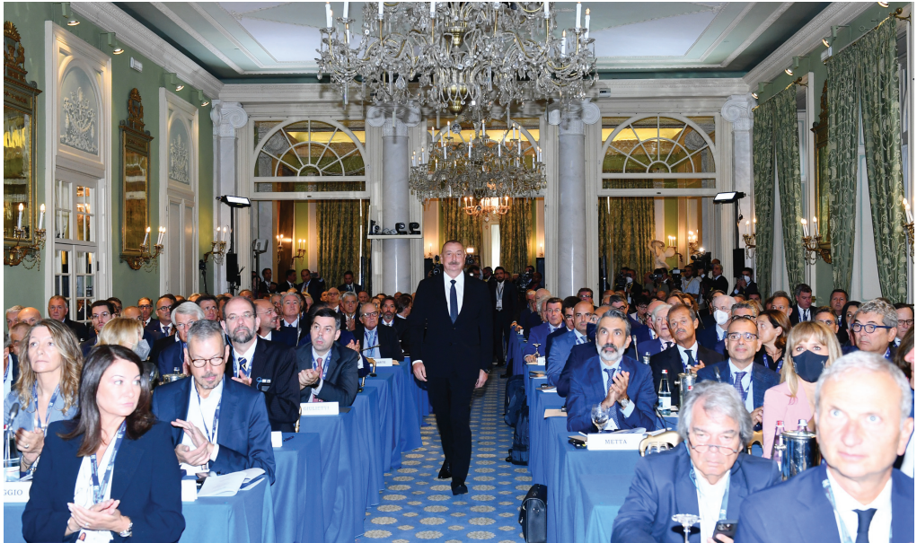
İtaliyada beynəlxalq forum. 2 sentyabr 2022-ci il