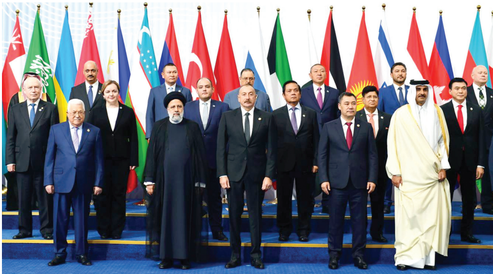
Asiyada Qarşılıqlı Fəaliyyət və Etimad Tədbirləri üzrə Müşavirənin Zirvə Toplantısı. 13 oktyabr 2022-ci il