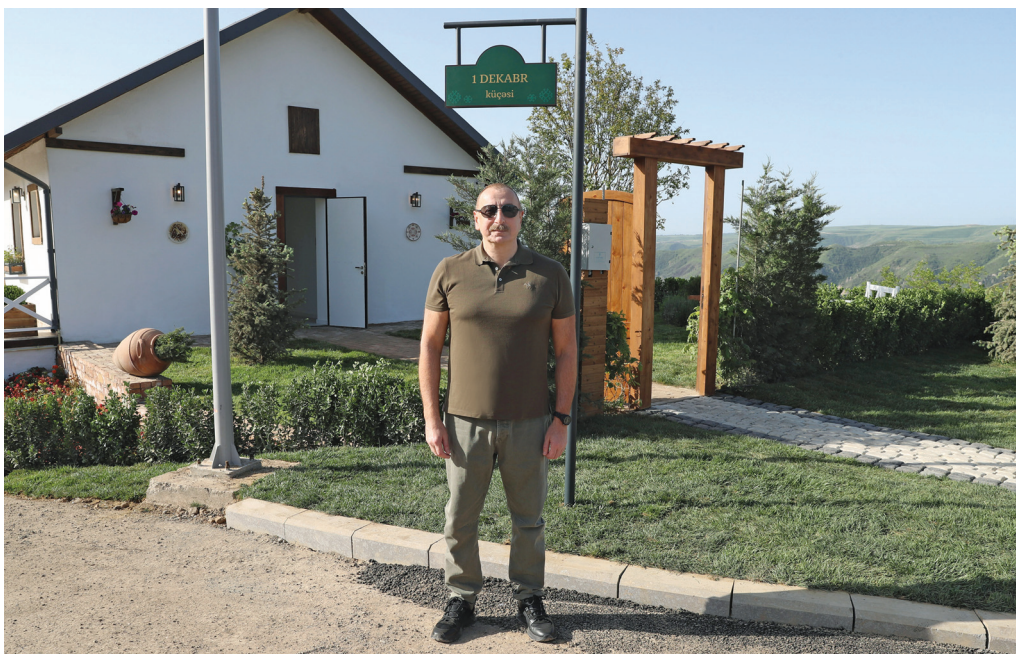
Laçın şəhərinə qayıdan əhali ilə görüş. 28 may 2023-cü il