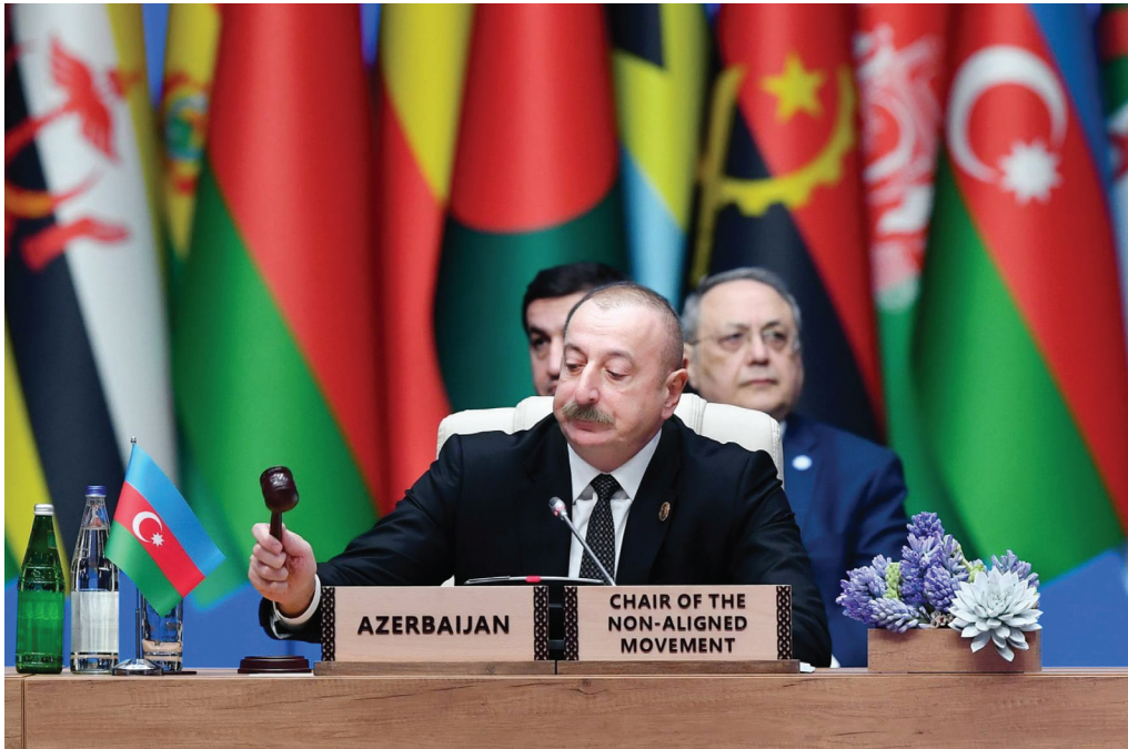
Bakıda Qoşılmama Hərəkatının Zirvə görüşü. 2 mart 2023-cü il