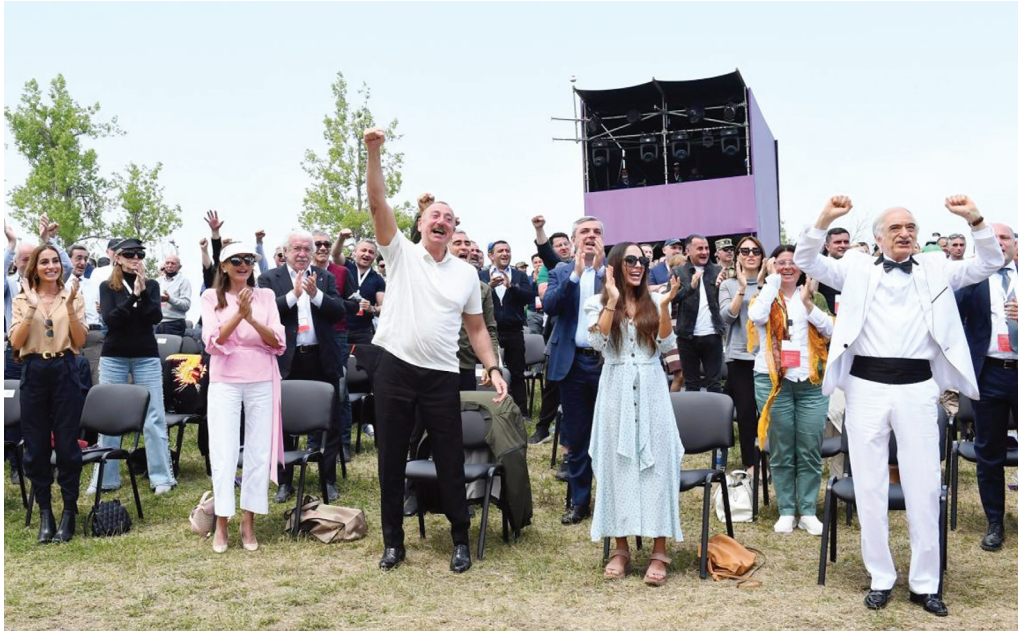
Şuşanın Cıdır düzündə "Xarıbülül" Musiqi Festivalı qala-konserti. 13 may 2021-ci il