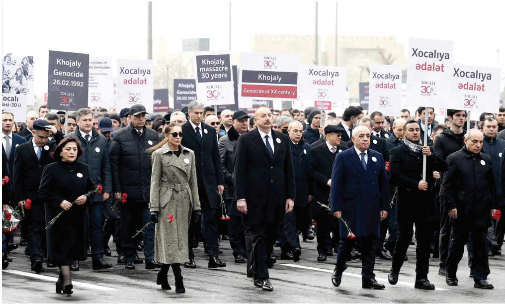
Xocalı soyqırımının 30-cu ildönümü ilə əlaqədar Bakıda ümumxalq yürüşü. 26 fevral 2022-ci il