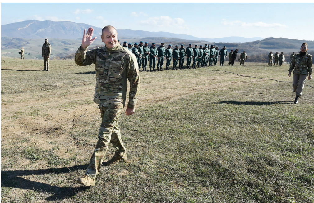
Şuşada hərbiçilərlə görüş. 8 noyabr 2021-ci il