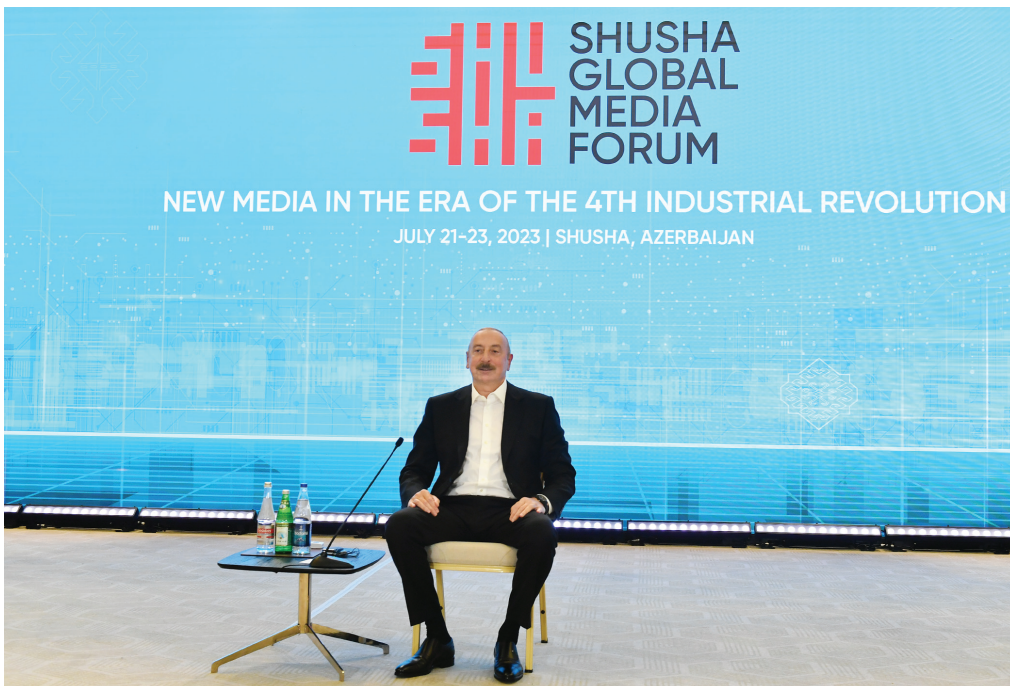
Şuşa Qlobal Media Forumu. 22 iyul 2023-cü il