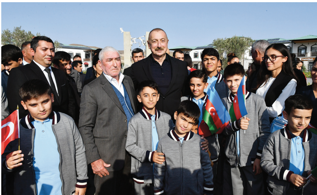
Zəngilanın Ağalı kəndində. 19 oktyabr 2022-ci il