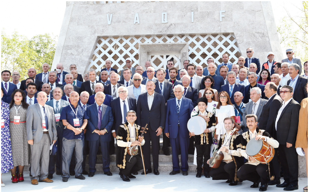
Şuşada "Vaqif Poeziya Günləri"nin açılışı. 30 avqust 2021-ci il