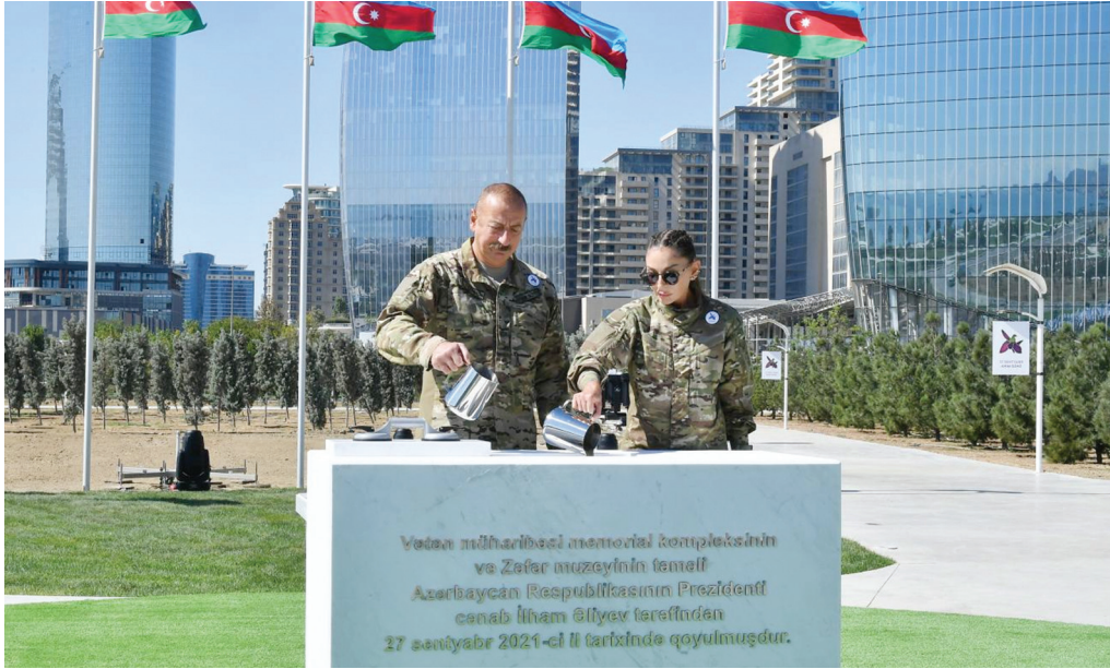
Vətən Müharibəsi Memorial Kompleksinin və Zəfər Muzeyinin təməlinin qoyulması mərasimi. 27 sentyabr 2021-ci il