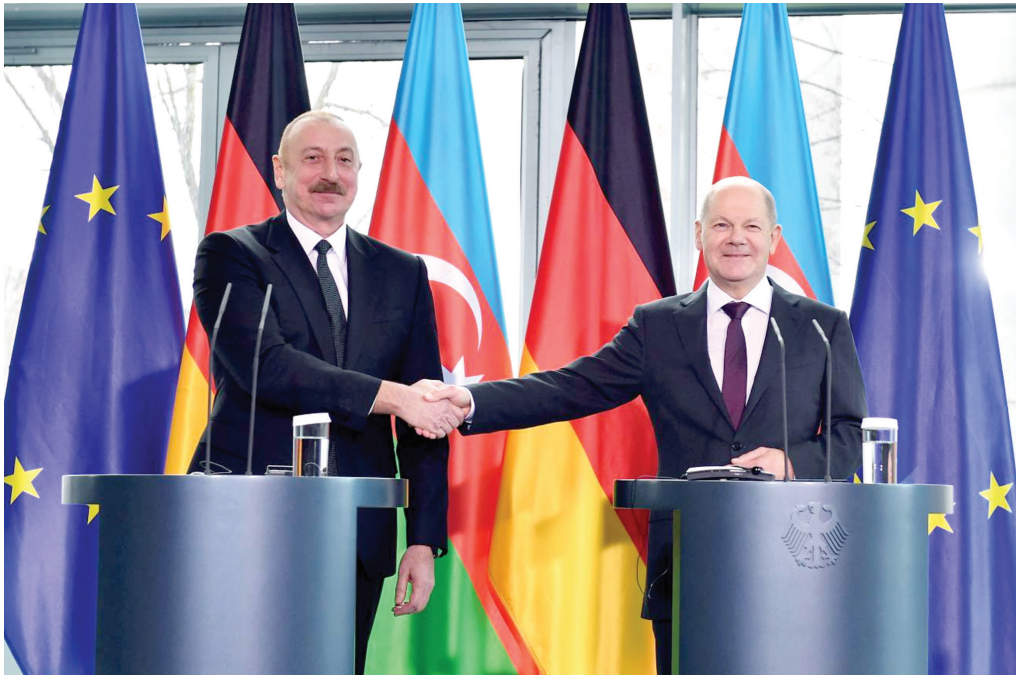
Almaniya Kansleri Olaf Şolts ilə görüş. 14 mart 2023-cü il