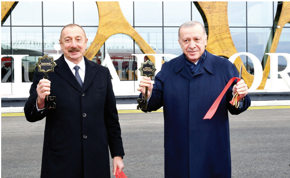
Füzuli Beynəlxalq Hava Limanının açılış mərasimi. 26 oktyabr 2021-ci il