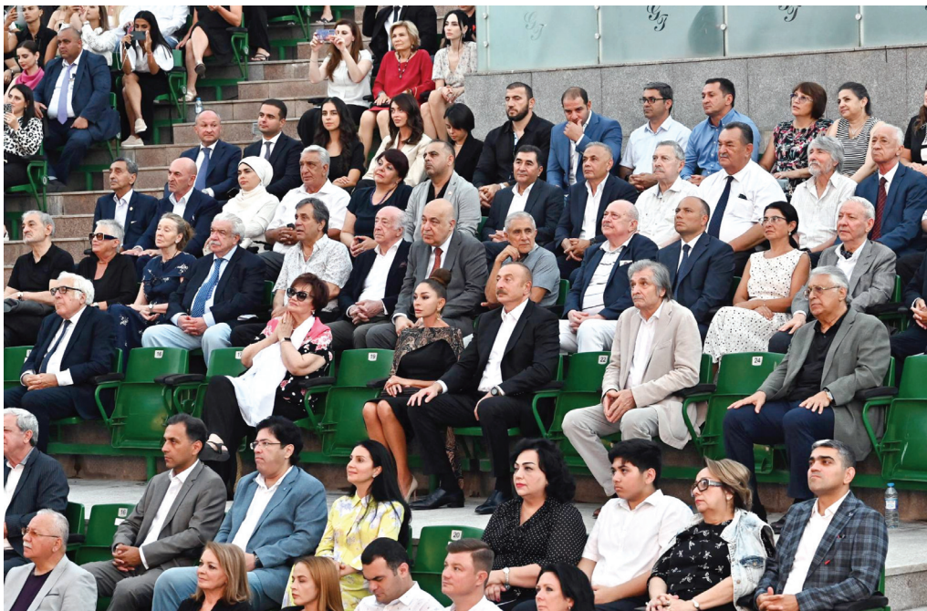
Müslüm Maqomayevin xatirə gecəsi. 17 avqust 2022-ci il