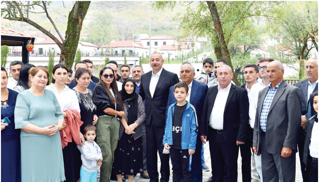
Laçının Zabux kəndində. 26 avqust 2023-cü il