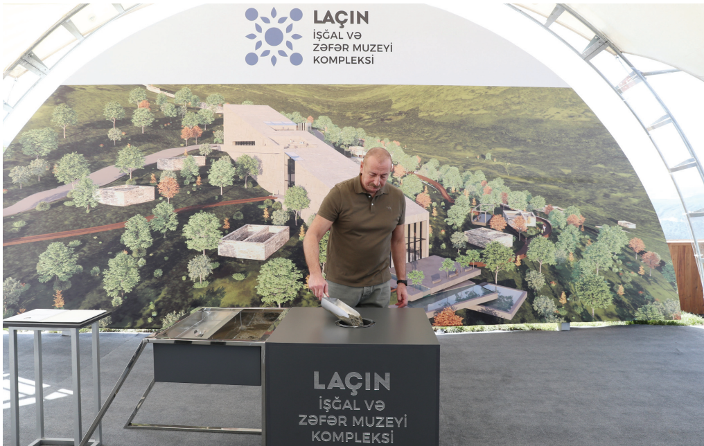
Laçın şəhərində İşçal və Zəfər Muzeyi Kompleksinin təməlinin qoyulması mərasimi. 28 may 2023-cü il