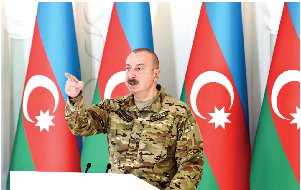
Zəfər Günü münasibətilə Şuşada təşkil olunan tədbir. 8 noyabr 2022-ci il