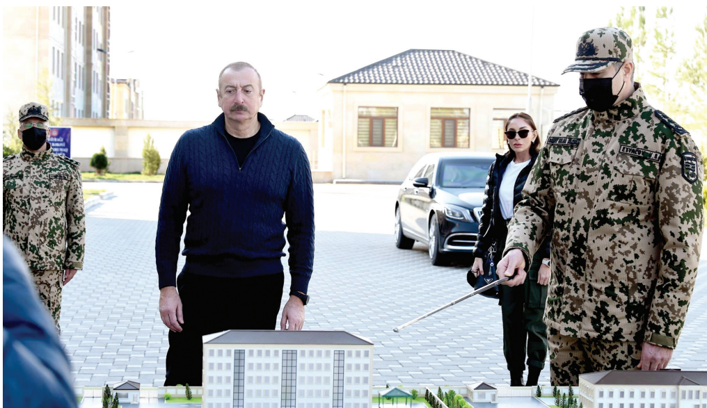
Daxili İşlər Nazirliyi Daxili Qoşunlarının Ağcabədi rayonunda yeni inşa olunan hərbi şəhərciyinin açılışı. 14 fevral 2022-ci il