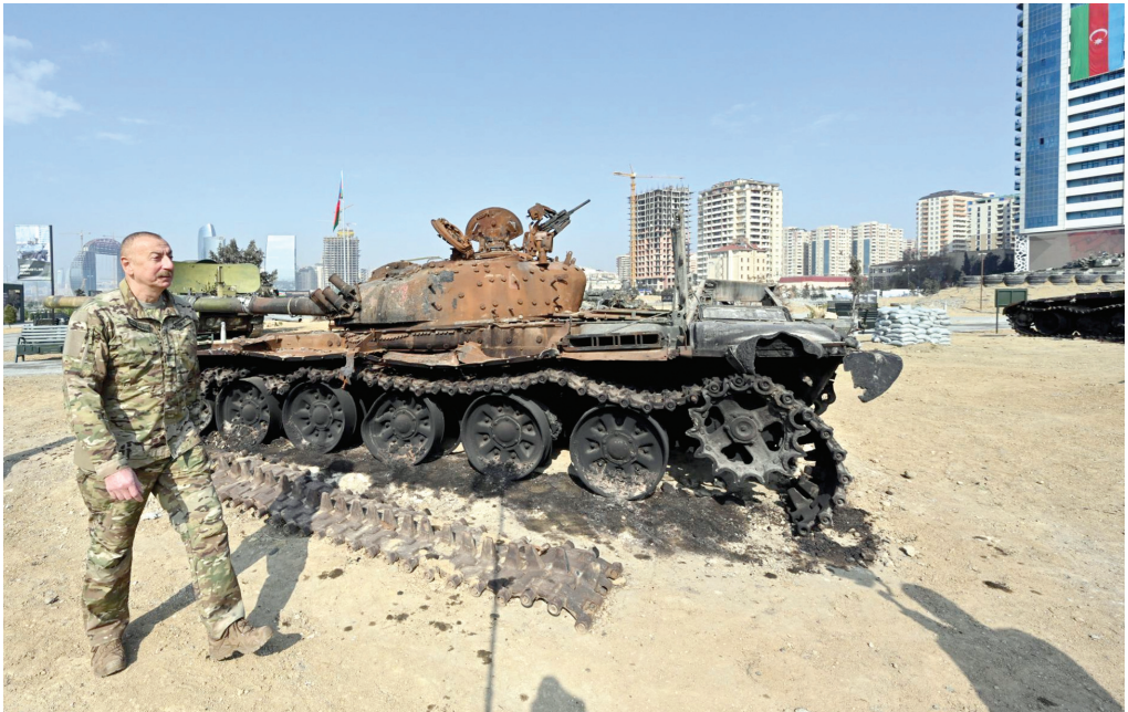
Bakıda Hərbi Qənimətlər Parkının açılışı. 12 aprel 2021-ci il