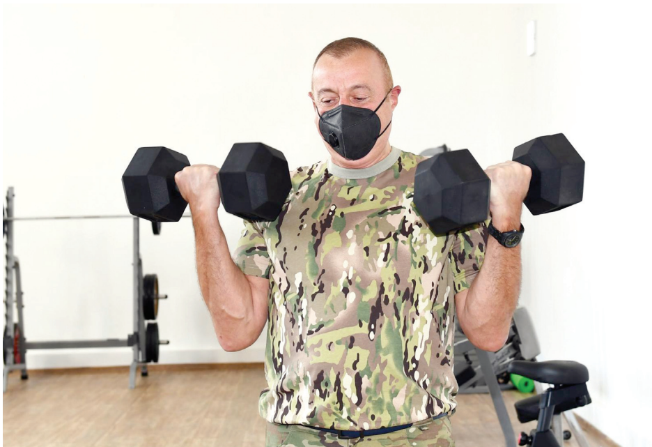
Cəbrayıl rayonunda Dövlət Sərhəd Xidmətinin hərbi hissəsinin açılışı. 26 aprel 2021-ci il