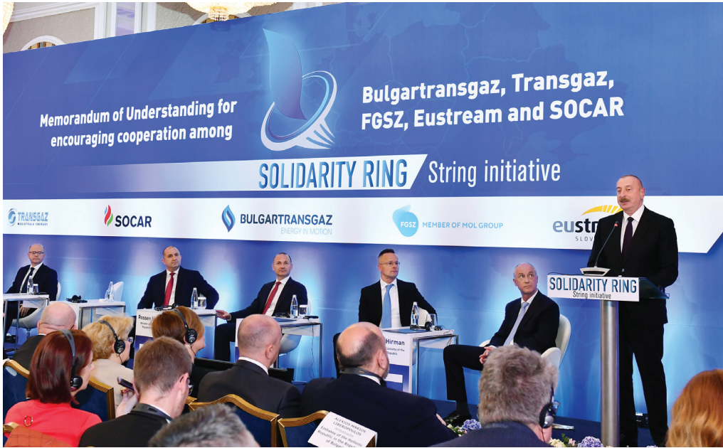
Bolqarıstana anlaşma memorandumunun imzalanması mərasimi. 25 aprel 2023-cü il