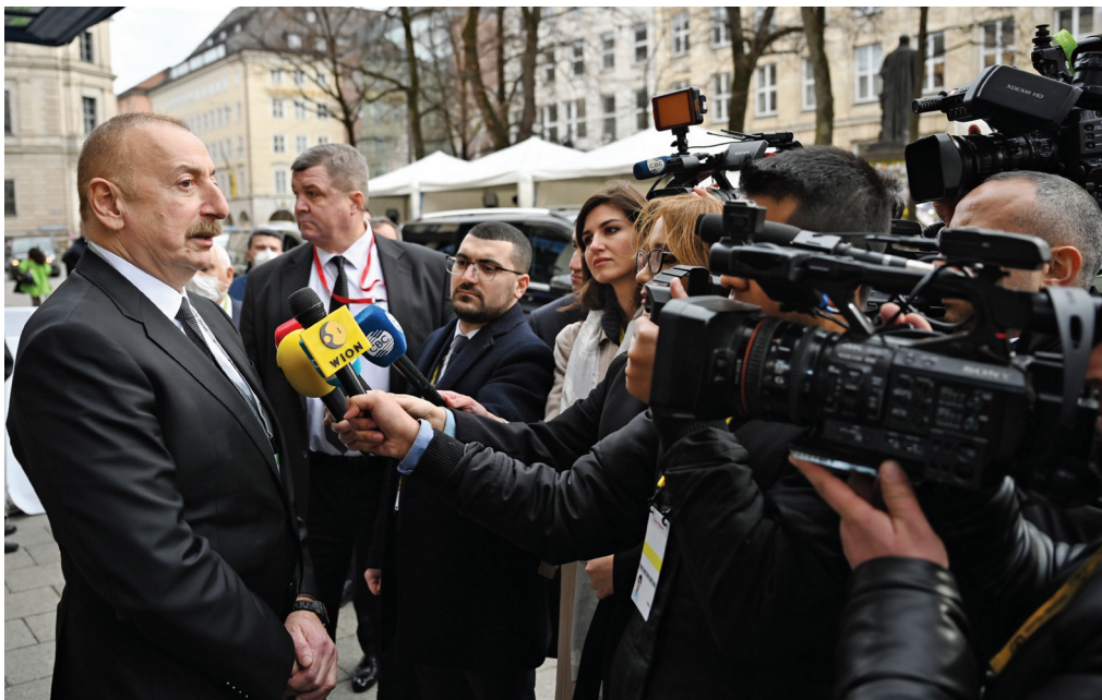
Mühendə televiziya kanallarına müsahibə. 18 fevral 2023-cü il