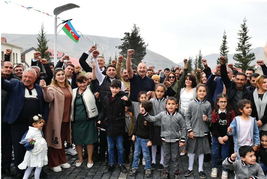
Talış kəndində. 18 mart 2023-cü il