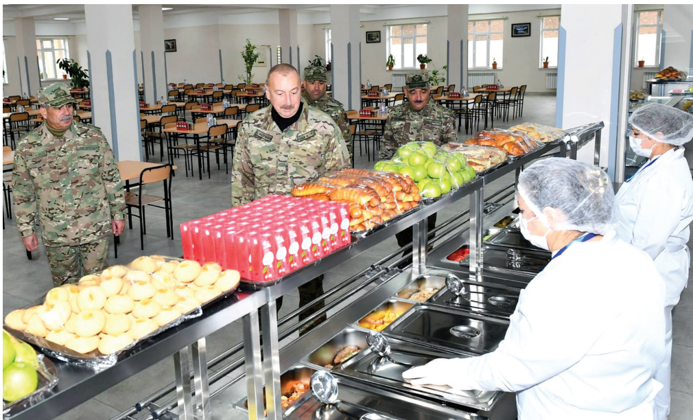
Füzuli rayonunda Müdafiə Nazirliyinin hərbi hissəsində. 8 noyabr 2022-ci il