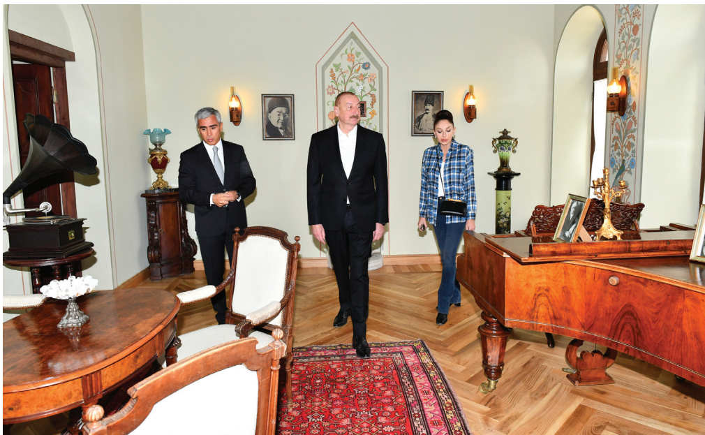
Şuşada Mehmandarovların malikanə kompleksinin açılışı. 09 may 2023-cü il