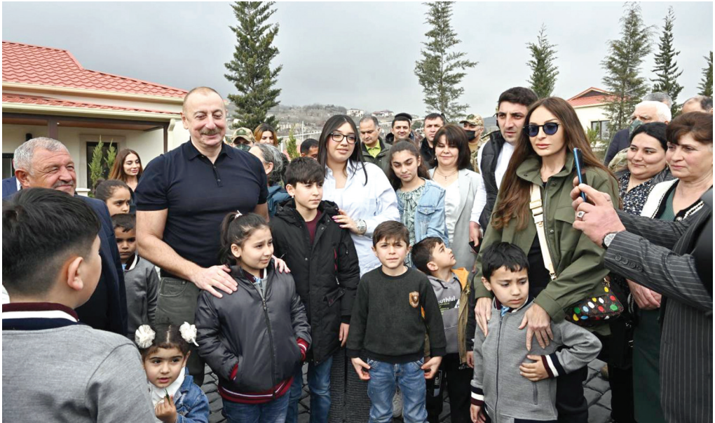
Talış kəndində. 18 mart 2023-cü il