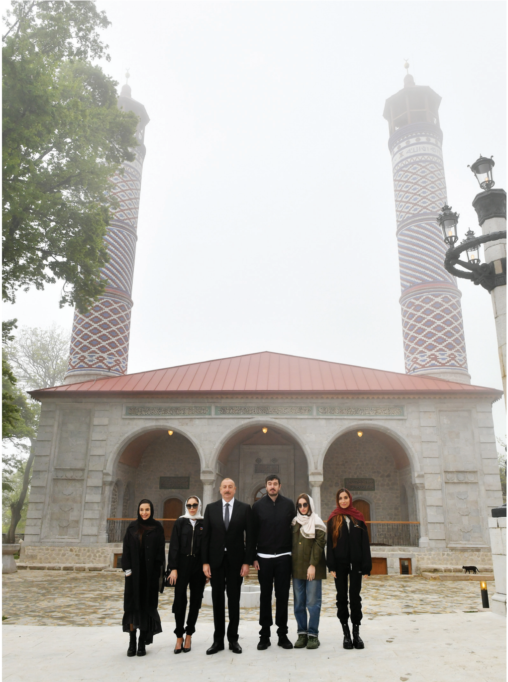
Şuşada Yuxarı Gövhər ağa məscidinin açılışı. 10 may 2023-cü il