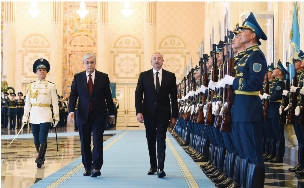
Qazaxıstana rəsmi səfər. 10 aprel 2023-cü il