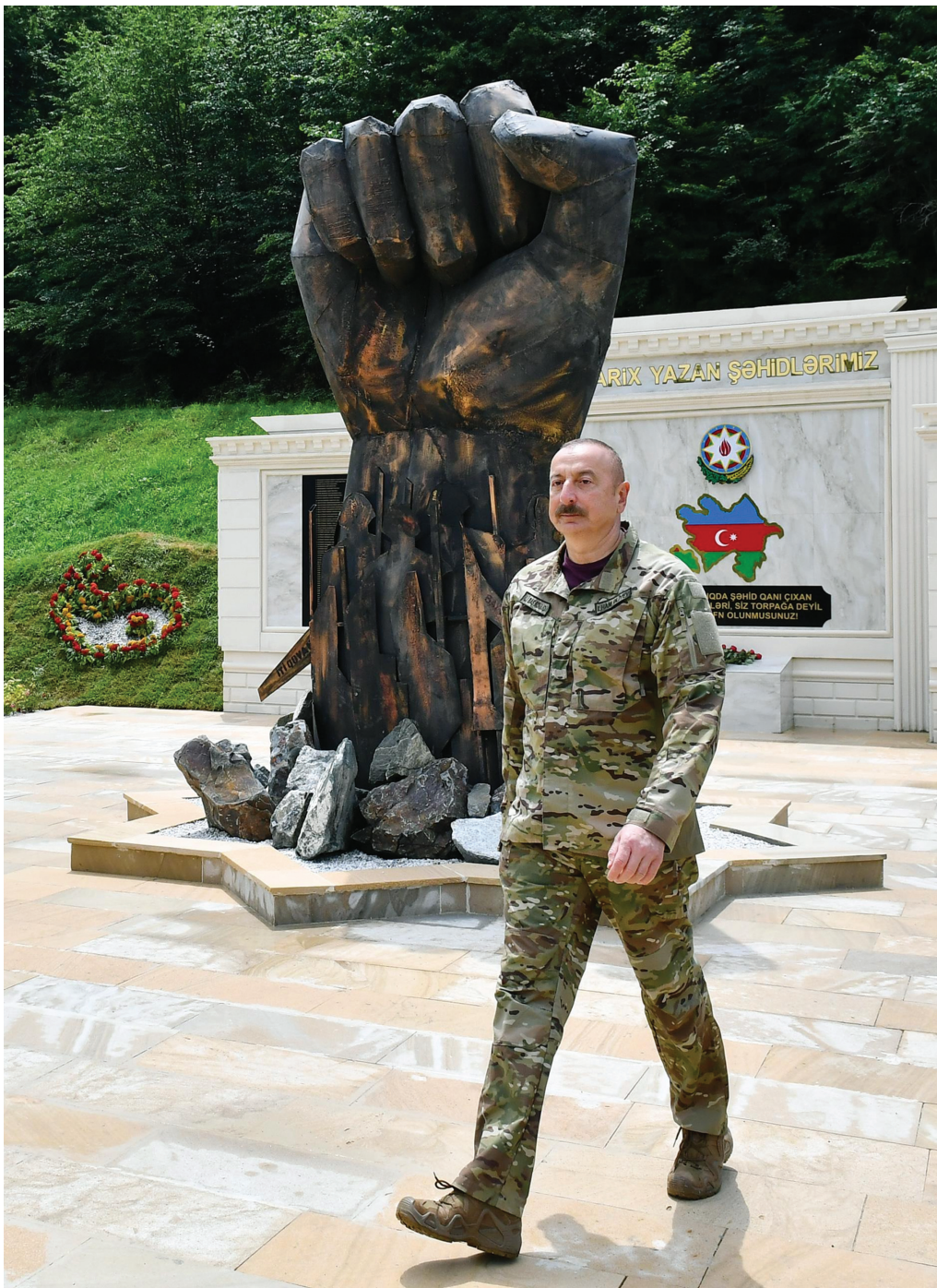
Kəlbəcər rayonunda hərbi hissənin açılışı. 27 iyun 2022-ci il