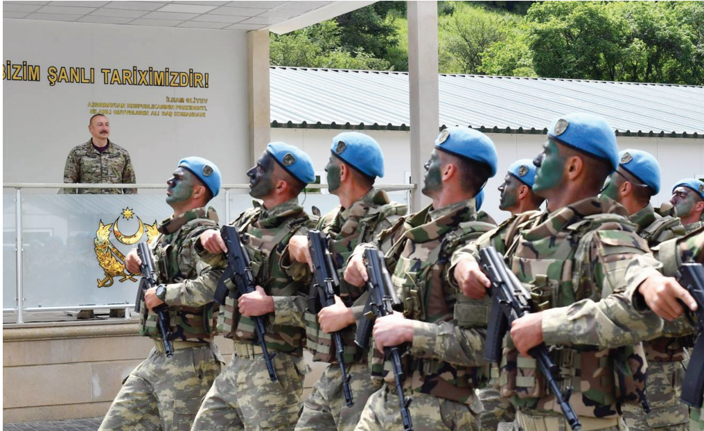
Kəlbəcər rayonunda hərbi hissənin açılışı. 27 iyun 2022-ci il