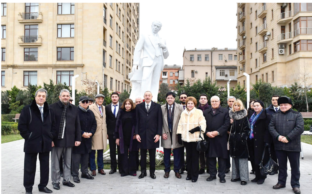
Tofiq Quliyevin abidəsinin açılışı. 8 fevral 2023-cü il