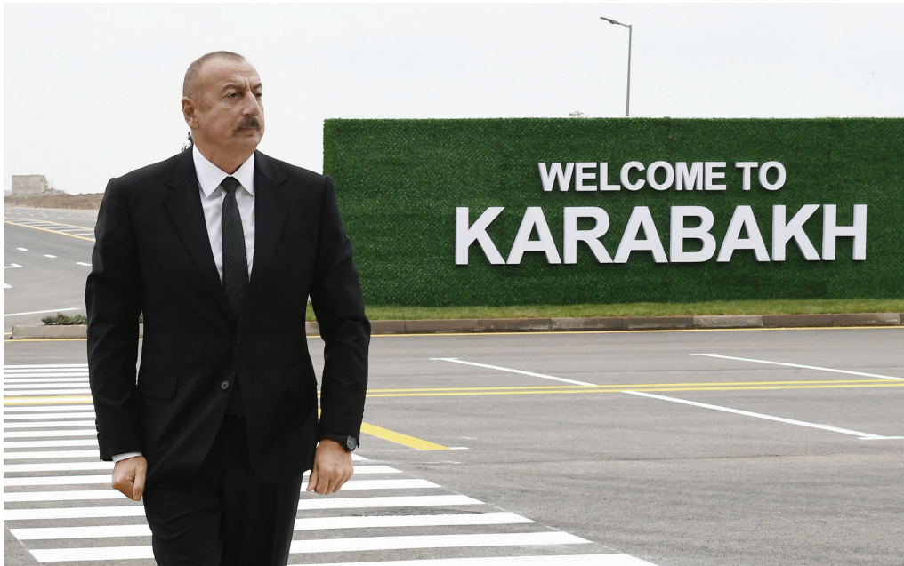
Füzuli Beynəlxalq Hava Limanında. 18 oktyabr 2021-ci il