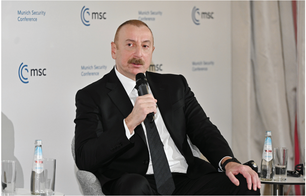
Münhen Təhlükəsizlik Konfransının plenar iclası. 18 fevral 2023-cü il