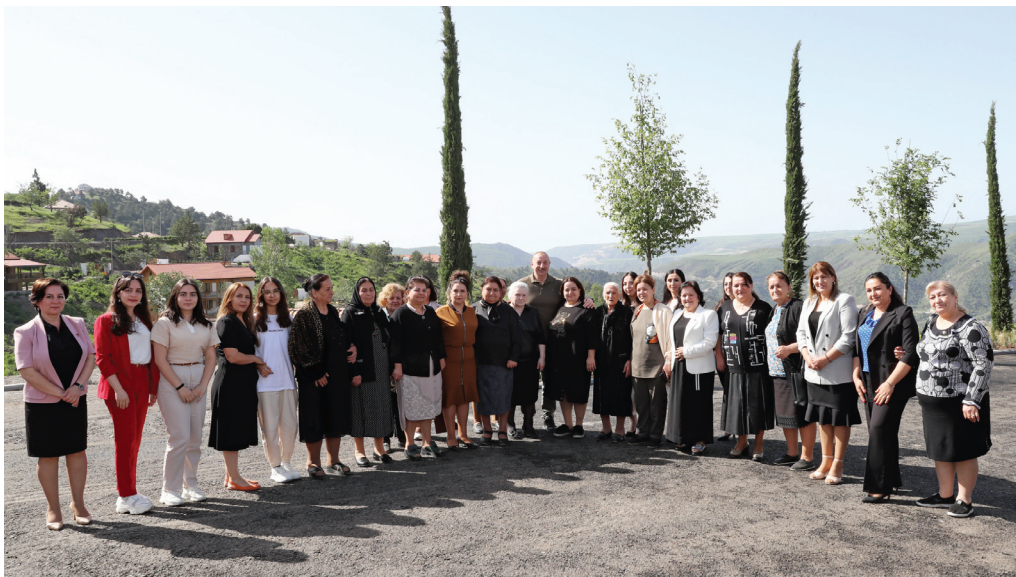
Laçın şəhərinə qayıdan əhali ilə görüş. 28 may 2023-cü il