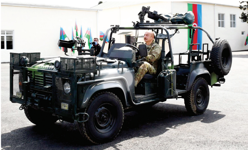
Cəbrayıl rayonunda Dövlət Sərhəd Xidmətinin hərbi hissəsinin açılışı . 26 aprel 2021-ci il