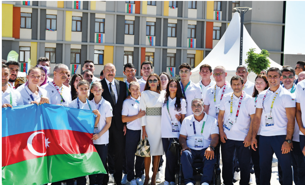
Konyada V İslam Həmrəyliyi Oyunlarında ölkəmizi təmsil edən idmançılarla görüş. 9 avqust 2022-ci il